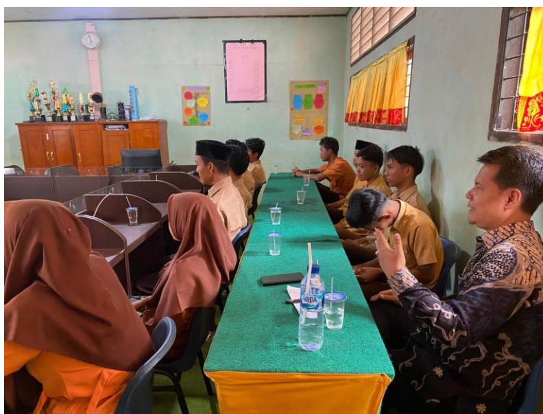
Gambar3. Sesi Tanya Jawab

Sebagai bahan Evaluasi terhadap pemahaman peserta pengabdian, maka dilakukan proses tanya jawab, untuk mengukur peningkatan pemahaman peserta dalam memahami materi yang diberikan.