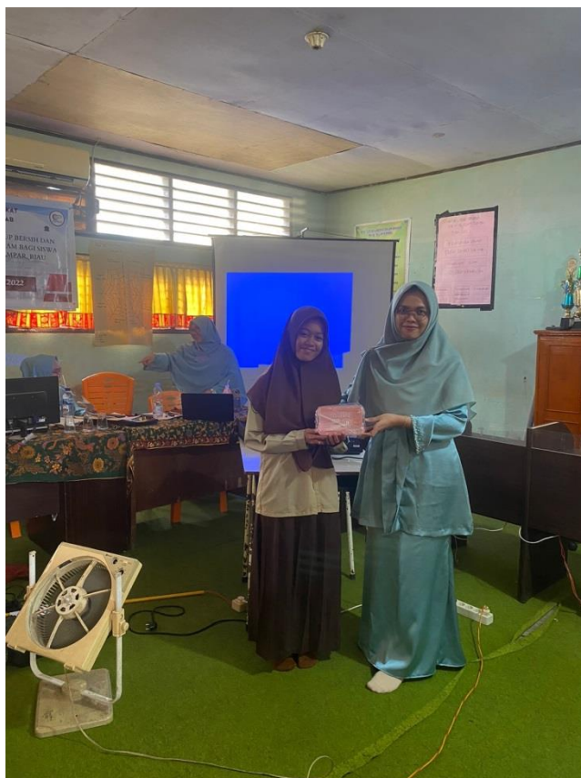
Gambar 4. Penyerahan Doorprize

Acara ditutup dengan photo Bersama di halaman sekolah, dan penyerahan simbolis kenang-kenangan obat dari tanaman obat keluarga.