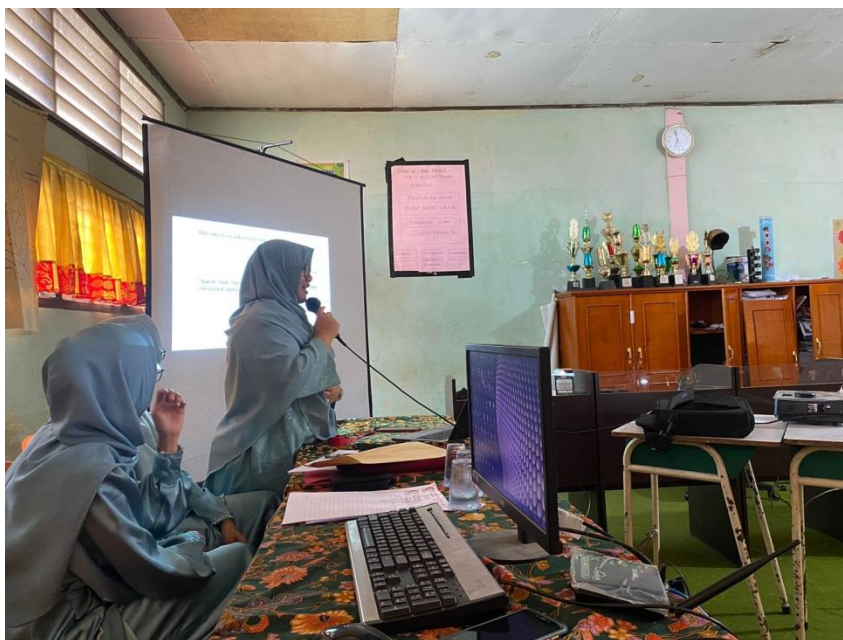
Gambar 2. Pemberian Materi TOGA

Sebagai bahan Evaluasi terhadap pemahaman peserta pengabdian, maka dilakukan proses tanya jawab, untuk mengukur peningkatan pemahaman peserta dalam memahami materi yang diberikan.