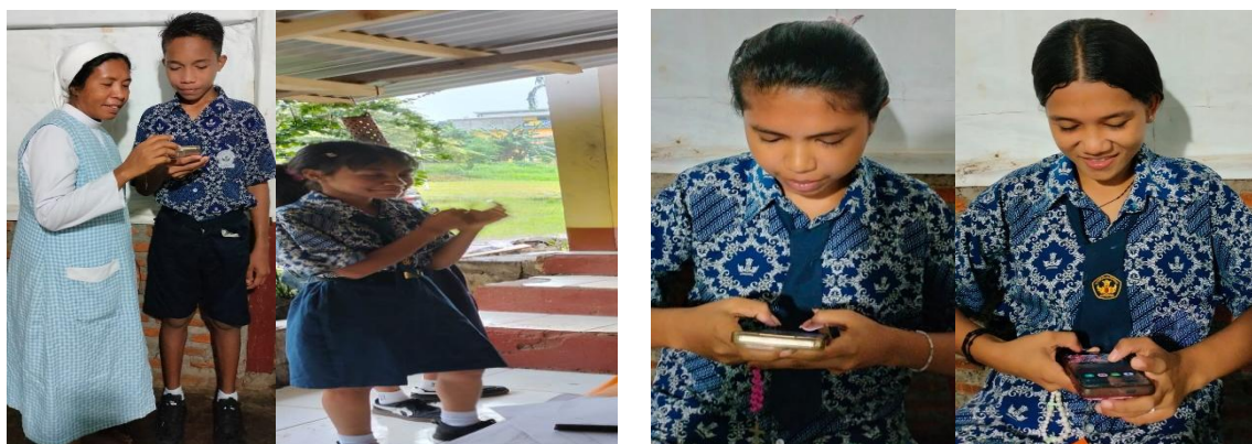
Gambar 2. Pelaksanaan Pelatihan Menggunakan Aplikasi Duolingo

Para pelatih mengintegrasikan penggunaan aplikasi Duolingo ke dalam proses pembelajaran bahasa Inggris dengan memberikan berbagai latihan yang meliputi pengenalan kosa kata, latihan pelafalan, pemahaman kalimat, serta latihan mendengar. Selain itu, tim pelatih juga memberikan pendampingan secara personal kepada siswa yang mengalami kesulitan selama proses pelatihan berlangsung. Umpan balik juga diberikan kepada siswa untuk mengetahui tingkat pemahaman mereka terhadap materi yang disampaikan serta membantu siswa menyelesaikan latihan yang tersedia dalam aplikasi.