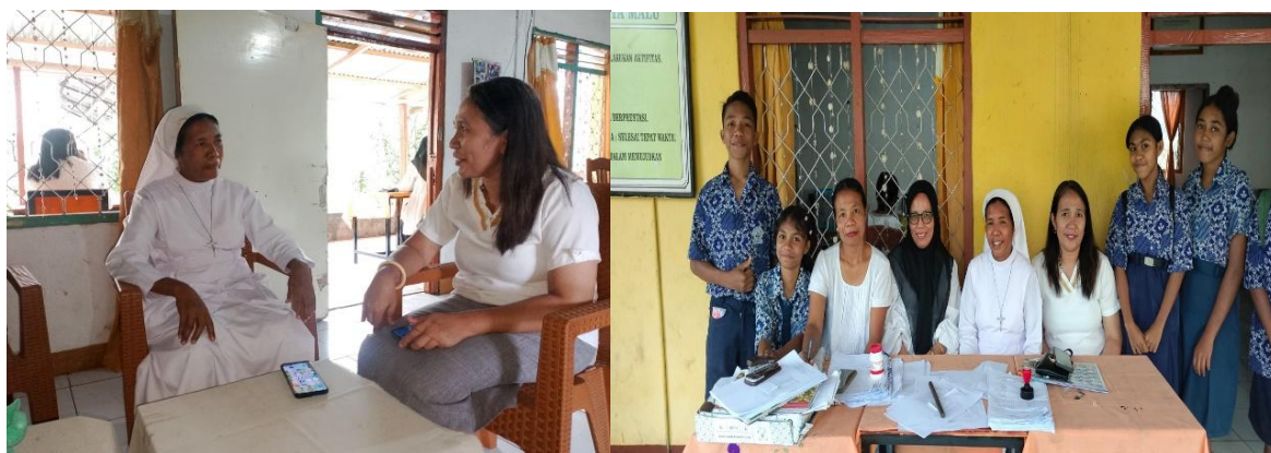
Gambar 1. Survei Pengumpulan Kebutuhan

Tahapan kedua merupakan tahap pelaksanaan kegiatan yang dilaksanakan pada tanggal 3–4 Maret 2026 sesuai dengan jadwal kegiatan yang telah disusun sebelumnya. Pada tahap ini dilakukan pelatihan penggunaan aplikasi Duolingo yang menjadi inti dari kegiatan Pengabdian kepada Masyarakat. Kegiatan pelatihan dilaksanakan dengan melibatkan 19 siswa-siswi SMPS Baipito Watowiti sebagai peserta.