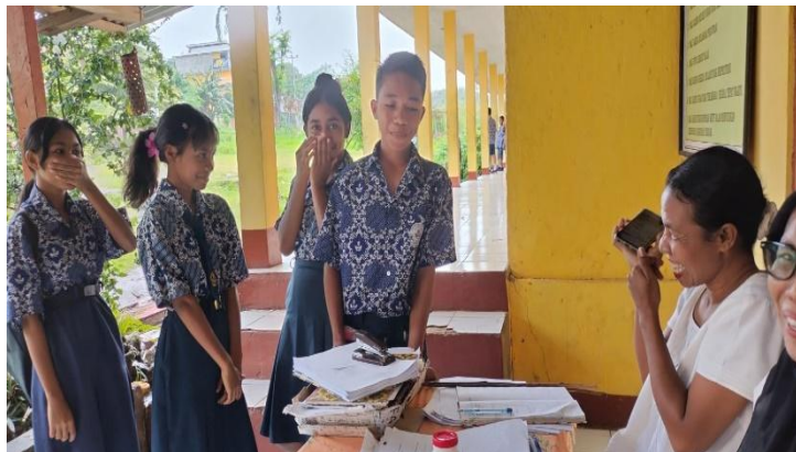
Gambar 3. Kuesioner Umpan Balik dan Evaluasi

Hasil evaluasi menunjukkan bahwa sebagian besar siswa memberikan respon positif terhadap pelatihan yang telah dilakukan. Berdasarkan data yang ditampilkan pada grafik hasil pelatihan, sebanyak 85% peserta pelatihan menyatakan setuju bahwa aplikasi Duolingo mudah digunakan serta membantu mereka memahami materi pembelajaran bahasa Inggris dengan lebih baik. Selain itu, siswa juga menyatakan bahwa metode pembelajaran berbasis permainan yang diterapkan dalam aplikasi Duolingo mampu meningkatkan motivasi belajar mereka.