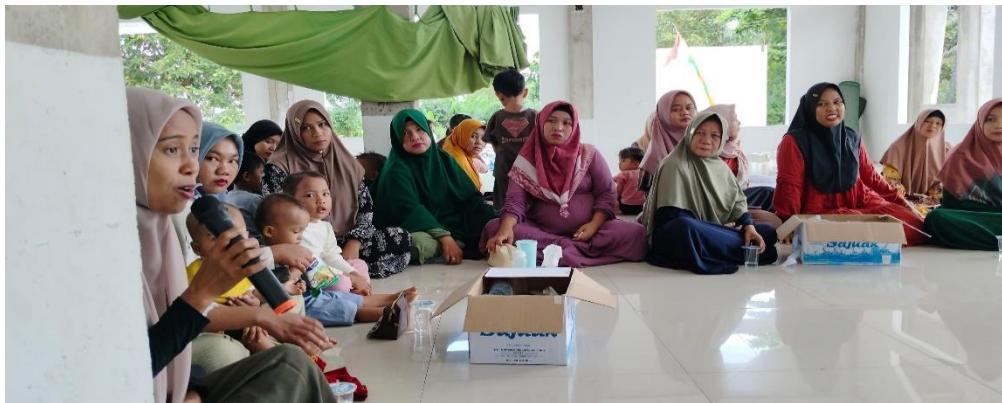
Gambar 2 . Sesi tanya jawab mengenai Aplikasi ejellycandy.com

Kegiatan selanjutnya, setelah selesai pemberian materi tentang e-comarce kemudian melakukan sesi tanya jawab kepada audiens atau ibu-ibu desa teluk kenidai dan ibu-ibu setempat sangat antusias dalam sesi tanya jawab, bahkan beberapa audiens melakukan konsultasi terhadap permasalahan penjualan kedepan dari sisi pengemasan dan lainnya kepada pemateri, sebagai apresiasi terhadap antusias audiens maka ada sedikit pemberian hadiah kepada ibu-ibu desa teluk kenidai yang bertanya.