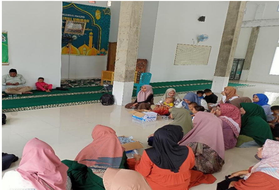
Gambar 1. Pemberian materi stunting

dosen dari fakultas teknik. Mahasiswa ikut berpartisipasi dalam kegiatan seperti melakukan dokumentasi serta ikut dalam penatalaksanaan pengabdian bersama para dosen. Hal ini dapat dilihat pada gambar 1.