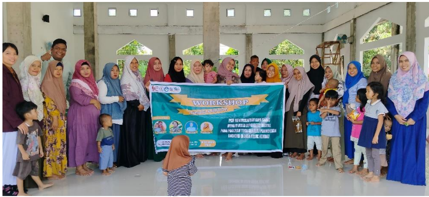
Gambar 6. Foto Akhir Sesi Pemaparan Materi.