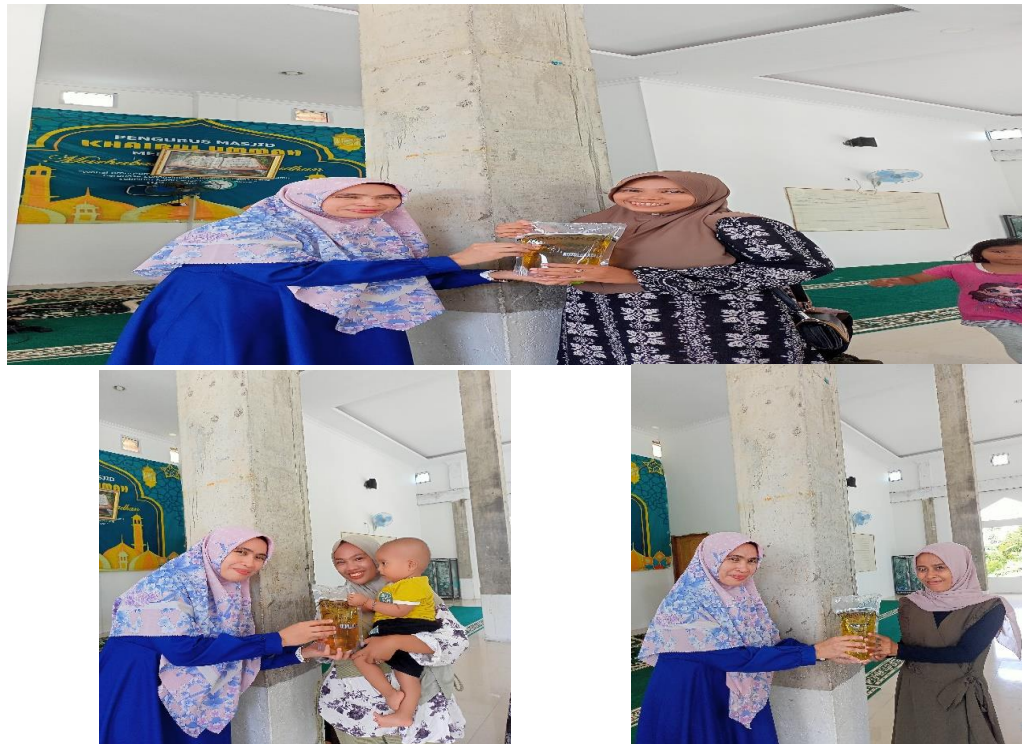
Gambar 3. Pemberian apresiasi oleh pemateri kepada audiens

Kegiatan selanjutnya, setelah selesai pemberian materi E- Comarce kemudian melakukan sesi tanya jawab kepada audiens atau ibu-ibu desa teluk kenidai.dan ibu-ibu setempat sangat antusias dalam sesi tanya jawab, bahkan beberapa audiens melakukan konsultasi terhadap permasalahan penjualan secara konvensional dan modern produk fantasi jely.